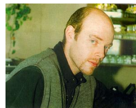
34, France French/Italian psychologist, married reading, watching TV, painting